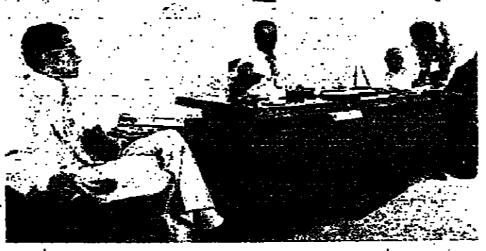
الحافظ ناضر خلال الاجتماع لبحث وضع البيع

الوزير ابراهيم شحادة مستعدون ترك كرسى الحكم لتخلفا حكومة سيمابين